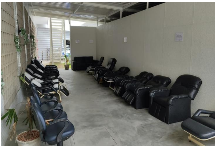
ÁREA DE DESCANSO EXTERNA