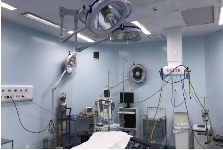
SALA CIRÚRGICA 6