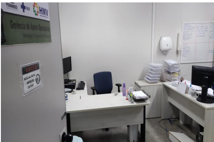
GERÊNCIA DE APOIO OPERACIONAL