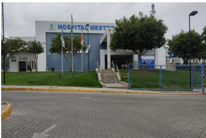
FRENTE DO HOSPITAL MESTRE VITALINO